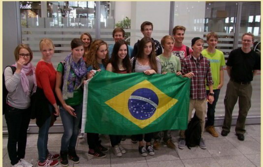
Die LfG-Reisegruppe kurz vor dem Abflug am Düsseldorfer Flughafen