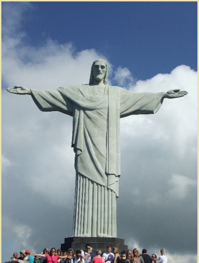
Jesus é brasileiro

Die Ankündigung unseres Begleiters, Herrn Kosinski, es handele sich bei der Reise um eine Schulveranstaltung („Ihr wisst ja: Kein Alkohol, keine Drogen, und von der Sache mit den neun Monaten habt ihr ja auch schonmal gehört...“) trübte die Stimmung keineswegs. Bei unserer Rückkehr nach São Paulo waren wir um tolle Fotos, viele Souvenirs und unvergessliche Erinnerungen reicher.