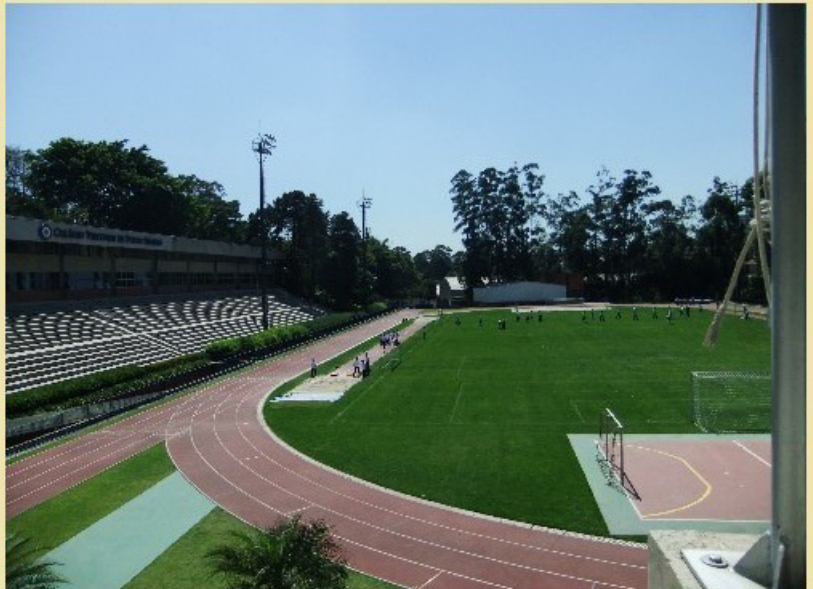
Der Sportplatz der UI

Nach dem eindrucksvollen Reiseprogramm begann auch für uns die Schulzeit. Die meisten von uns gingen an die Unidade III, die Schuleinheit im Stadtviertel Panambý, ich gehörte aber zu dem kleinen Teil der Gruppe, der an der Unidade I in Morumbi „zu Hause“ war. Wir erkundeten die Schule ausgiebig, gingen in die Klassen unserer Austauschpartner oder besuchten den Deutschunterricht jüngerer Klassen, wo wir als „echte“ Deutsche begeistert ausgefragt wurden und auch insofern begehrt waren, als dass viele Brasilianer auf einem Foto mit uns bestanden.