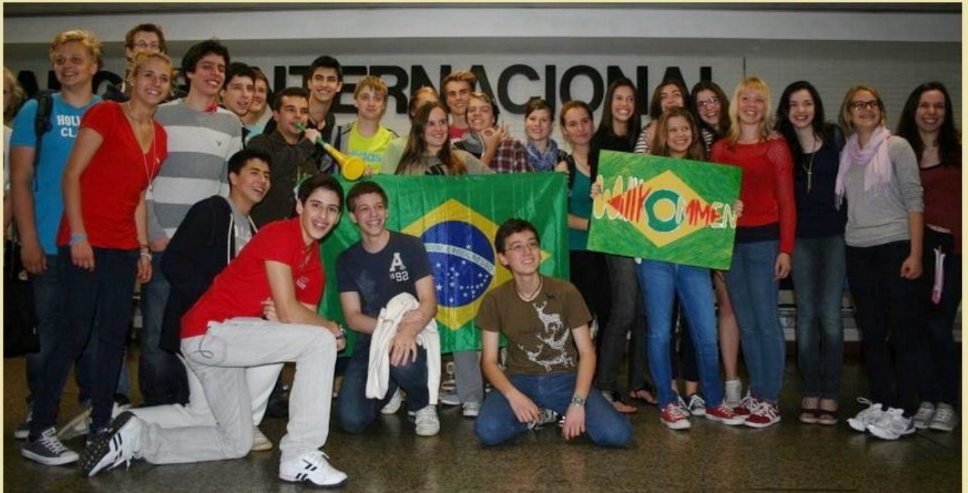
15 Stunden später: Freundlicher Empfang am Flughafen Guarulhos