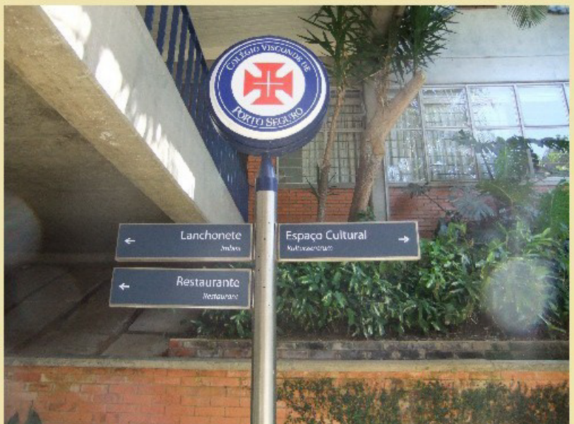
In der UI, einer der drei großen Gebäudekomplexe des Colégio Visconde de Porto Seguro.